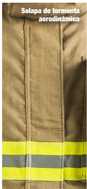
Solapa de tormenta aerodinámica