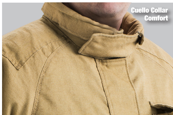
Cuello Collar Comfort