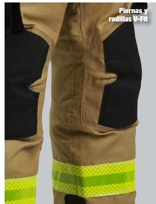
Piernas y rodillas V-Fit