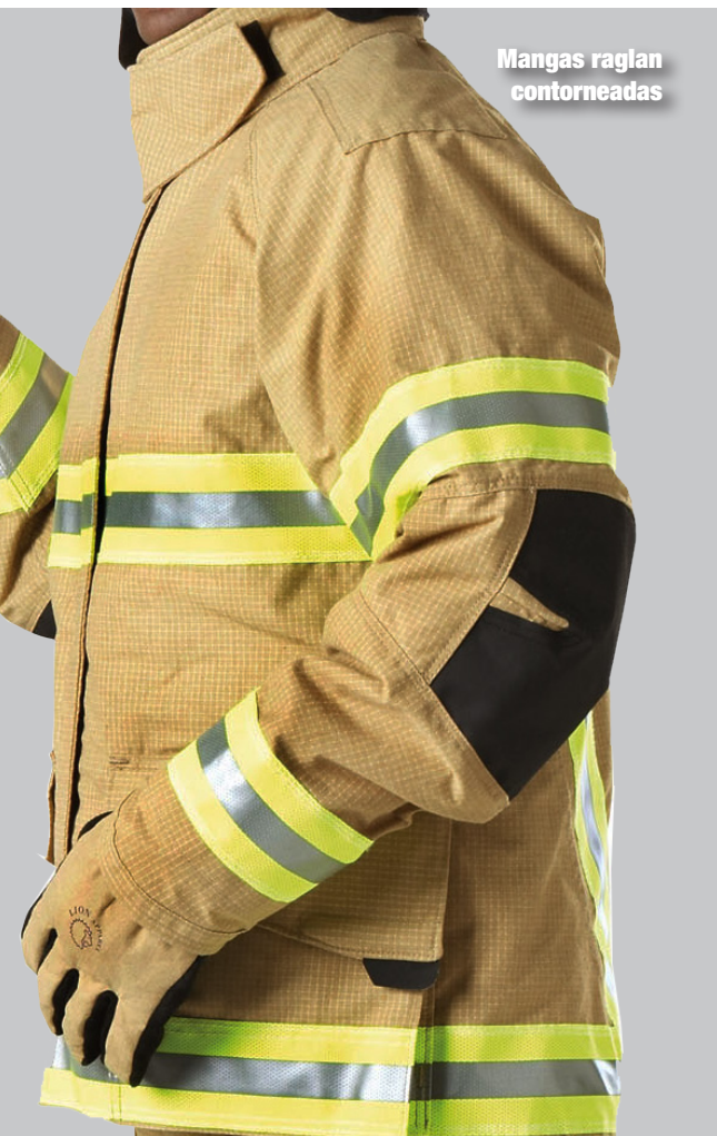
Mangas raglan contorneadas