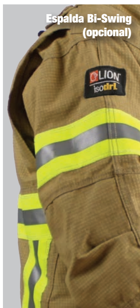
Espalda Bi-Swing (opcional)