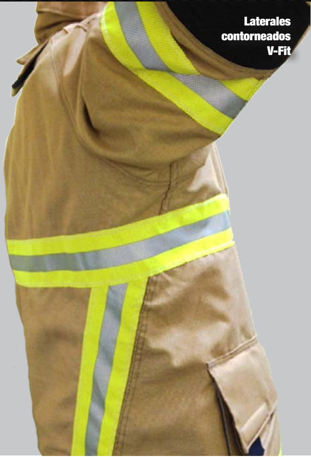
Laterales contorneados V-Fit

Traje de protección para bomberos de última generación que combina la tecnología utilizada en el combate con las actividades deportivas para lograr un rendimiento y ajuste excepcionales