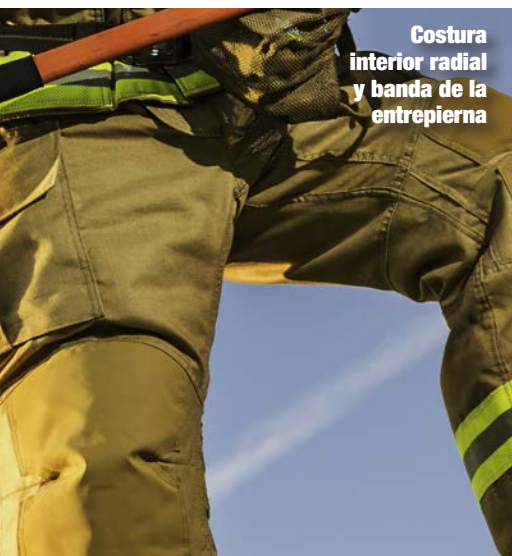
Costura interior radial y banda de la entretierna